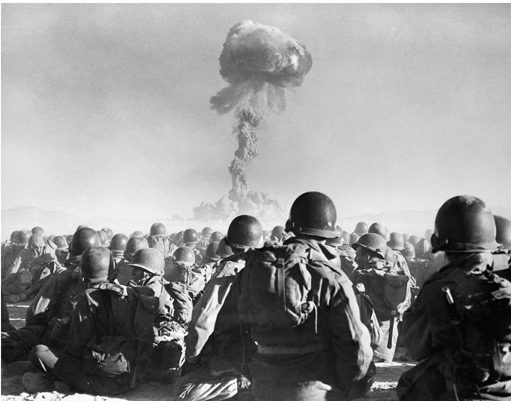
Военнослужащие 11-й воздушно-десантной дивизии армии США наблюдают за атомным взрывом на полигоне в пустыне, 1 ноября 1951

Поэтому исторически нормальный мир, над которым висит задрапированный ядерный дамоклов меч, – это мир конфликтов и войн. Сам ядерный меч при этом не исчез, он по-прежнему способен уничтожить человечество, но он зачехлен, что позволяет не считать исходящую от него угрозу актуальной. Действительно, всеобщее уничтожение может интересовать разве что террориста-маньяка. Вместо предметов ядерного арсенала в ход пошли неядерные мечи, сабли, шпаги, топоры, кинжалы и так далее. На ЯО в этих условиях как бы наложено негласное табу, ведь его применение, если логически рассуждать, уничтожит все то, что намереваются защитить, а в худшем случае – вообще все. Неудивительно, что многие уверились: ядерному оружию уготована судьба оружия химического, которое ограничено применялось в Первую мировую войну, но во Вторую оставалось на складах.