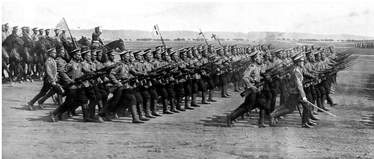
Третья мировая не будет похожа ни на Первую, ни на Вторую. На фото: русская пехота вовремя Первой мировой войны, 1914 год

Уже горят два очага мировой войны : Восточная Европа и Ближний Восток. Давно обозначился и третий: Восточная Азия (Тайвань, Корейский полуостров, Южно- и Восточно-Китайское моря). Россия непосредственно вовлечена в войну в Европе; ее интересы затронуты в Иране; и она может быть так или иначе задействована на Дальнем Востоке. Три очага – это не все. Могут быть созданы новые – от Арктики до Афганистана, и не только по периметру границ страны, но и внутри нее. Вместо прежних стратегий ведения войны, предусматривавших – наряду со сломом воли противника и лишением его способности сопротивляться – также и контроль над его территорией, современные стратегии ориентируются не на оккупацию вражеского государства, а на провоцирование внутренней дестабилизации и хаоса.