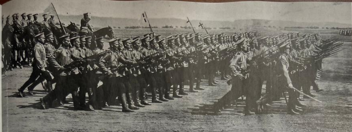
Третья мировая не будет похожа ни на Первую, ни на Вторую. На фото: русская пехота во время Первой мировой войны, 1914 год