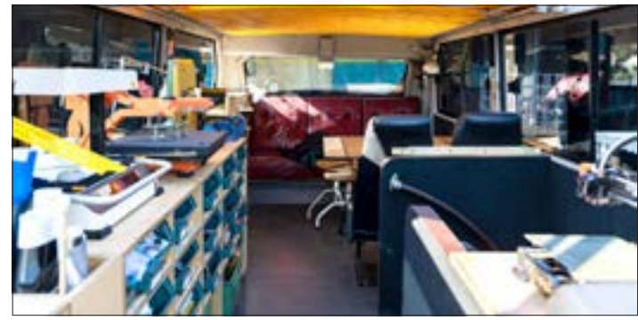
Fabmobil Ostercamp 2.

Am Montag (08.04.) von 15 – 16 Uhr und Dienstag (09.04.) von 14 – 16 Uhr steht der Truck allen interessierten Schüler_innen, deren Eltern, aber auch der Öffentlichkeit zur Erkundung zur Verfügung. Die Workshops finden täglich von 08:00 – 12:00 Uhr statt. Das FAB-Mobil ist ein fahrendes Kunst-, Kultur- und Zukunftslabor. Sinn des FAB-Mobil ist es, durch die regelmäßige Arbeit mit neuen Technologien ein tieferes Verständnis für Digitalität zu vermitteln. Der Doppeldeckerbus ist mit Digitaltechnik und Werkzeugmaschinen ausgestattet und bietet Workshops und Kurse an. Das Fabmobil ist regelmäßig unterwegs und fährt Schulen, Jugendzentren und andere Begegnungsorte an.