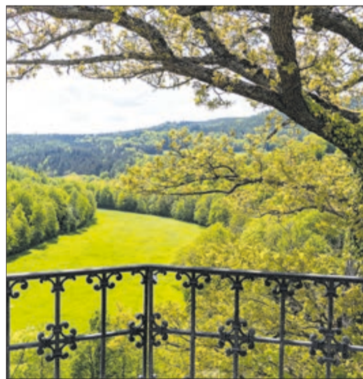
Die Aussicht in das Schwarzwald lässt das Herz jeden Naturfreundes aufleben.

genießt man eine kraftspendende Auszeit in den Bergen. Fünf Sterne Superior verpflichten. Die Wellnessresidenz Schalber überzeugt mit exquisitem Interieur, Stil und Geschmack. Gaumenfreuden auf höchstem Niveau werden vom hervorragenden Frühstück bis zum Fünf-Gänge-Wahlmenü am Abend serviert. Aus frischen, gesunden und erstklassigen Zutaten erschaffen Meisterköche Menükreationen, die das Auge ebenso begeistern wie den Gaumen. www.schalber.com