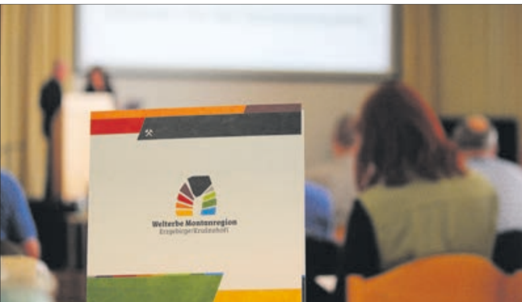
Aktuell fand eine Welterbe-Regionalkonferenz im Annaberg-Buchholzer Erzhammer statt. Eine weitere steht am 11. April im Winfriedhaus Schmiedeberg auf dem Programm.

Regionalkonferenz und Welterbetag am 2. Juni in der Saigerhütte