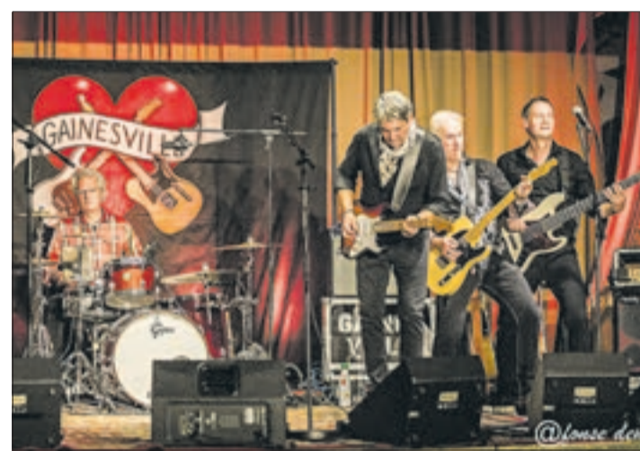
„Free Fallin“ ist einer der Hits, den die Band „Gainesville“ am 13. April in der Linde Affalter ganz sicher spielen wird.

Am 13. April können Sie den besten deutschen Tom-Petty-Sound genießen