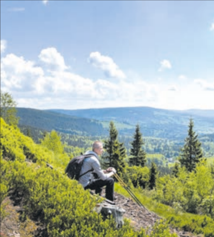
Wunderschöne Panoramaausblicke lassen sich im ganzen Thüringer Wald finden.