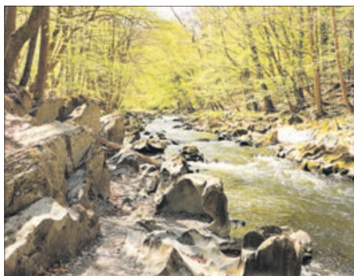
Die Strudeltöpfe im Schwarzwald sind ein beeindruckendes Naturschauspiel.

Natur in Harmonie im Schwarzwald Zuerst sehen Sie den Thüringer Wald, dann riechen Sie ihn, dann hören Sie die Tiere und am Ende Ihrer Wanderung durch das Tal spüren Sie die Lebendigkeit der Natur auch in sich. Das Schwarzwald erwartet Sie!