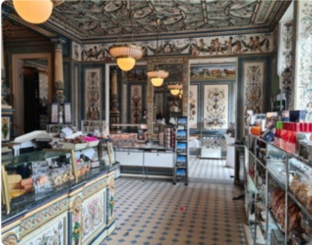
Pfunds Molkerei: Milchladen – Verkaufsraum