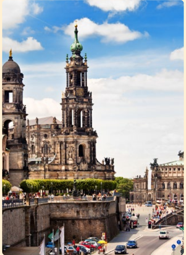
Brühlsche Terrasse, Dresden

Also: Klappt die Geschichtsbücher zu und erkundet mit uns die Orte, an denen Tradition und Moderne erlebbar werden!