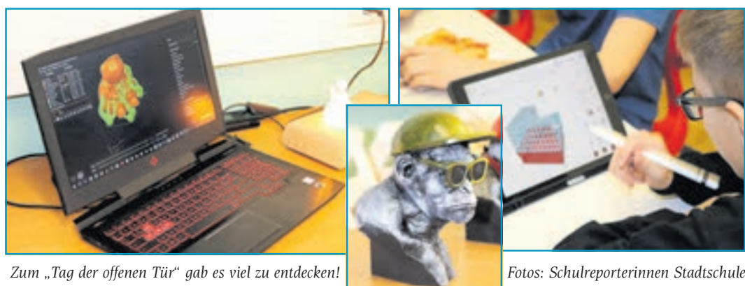
Zum „Tag der offenen Tür“ gab es viel zu entdecken!

Oberschule Stadtschule, Erlaer Straße 6, Tel.: 03774 23137, Mail: osstadtschule@schwarzenberg.de