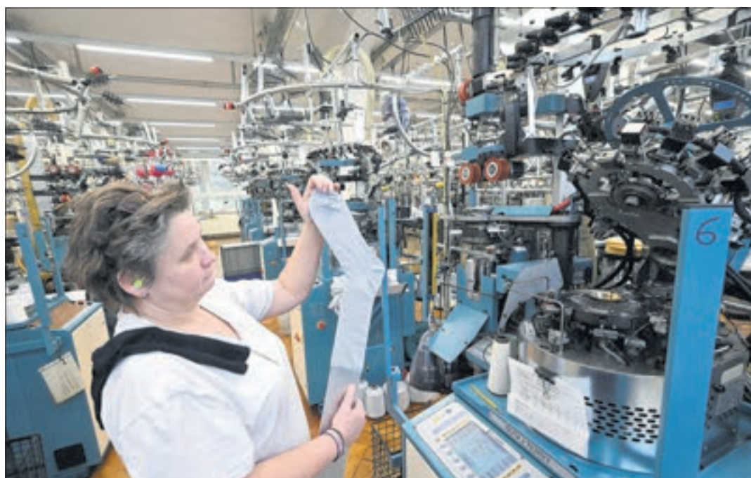
Die Stimmung bei den regionalen Textil-Unternehmen ist getrübt.