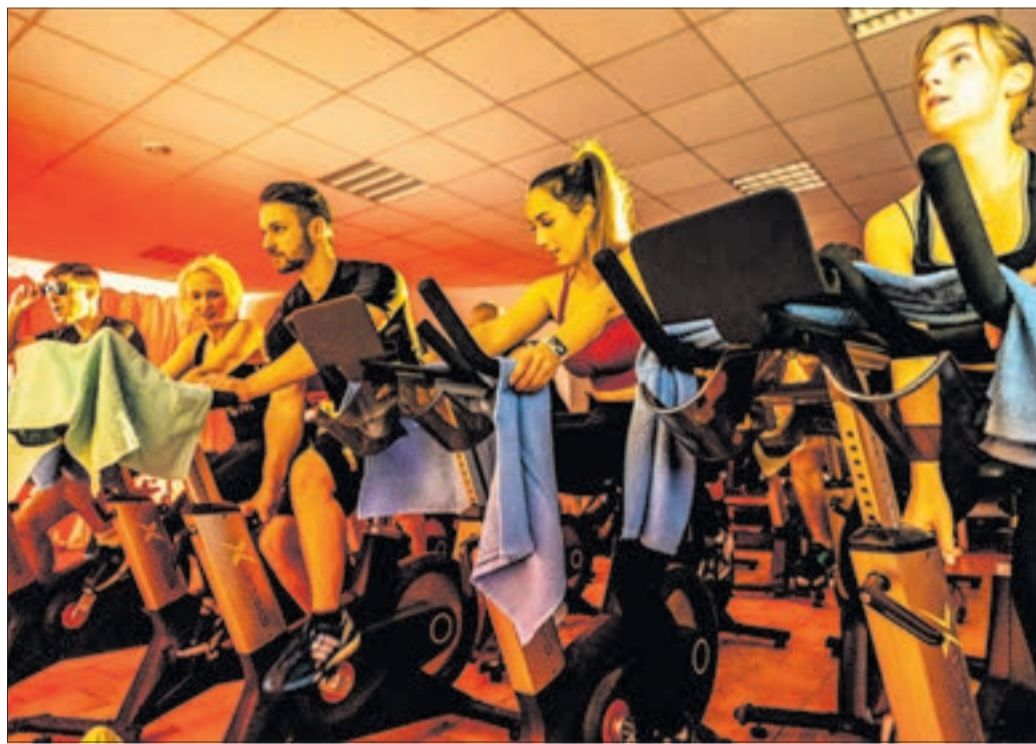
Auf die Räder heißt es jeden Mittwoch und Freitag im Sportletix-Club Bad Schlema.

Aue-Bad Schlema. Die Bässe wummern aus den Boxen, Dimitri Vegas & Like Mike sorgen an den Reglern für den passenden Sound zu einer abgefahrenen Trainingseinheit für echte Aufsteiger. Im 250 Quadratmeter großen Sportletix-Club in der Marktpassage Bad Schlema steigen sie auf 35 Indoor-Bikes, erleben einen perfekten Mix aus Sport und Party und einer ein-