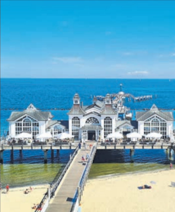
Aussicht auf die Seebrücke in Sellin.