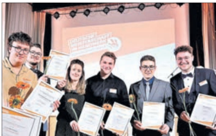
Neun Sieger aus Sachsen im Endausscheid der DM im Handwerk.

Das sind die ausgezeichneten Handwerkerinnen und Hand-