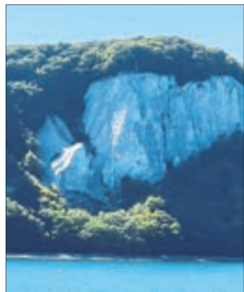
Mit Bootstouren kann man die Kreidefelsen bewundern.