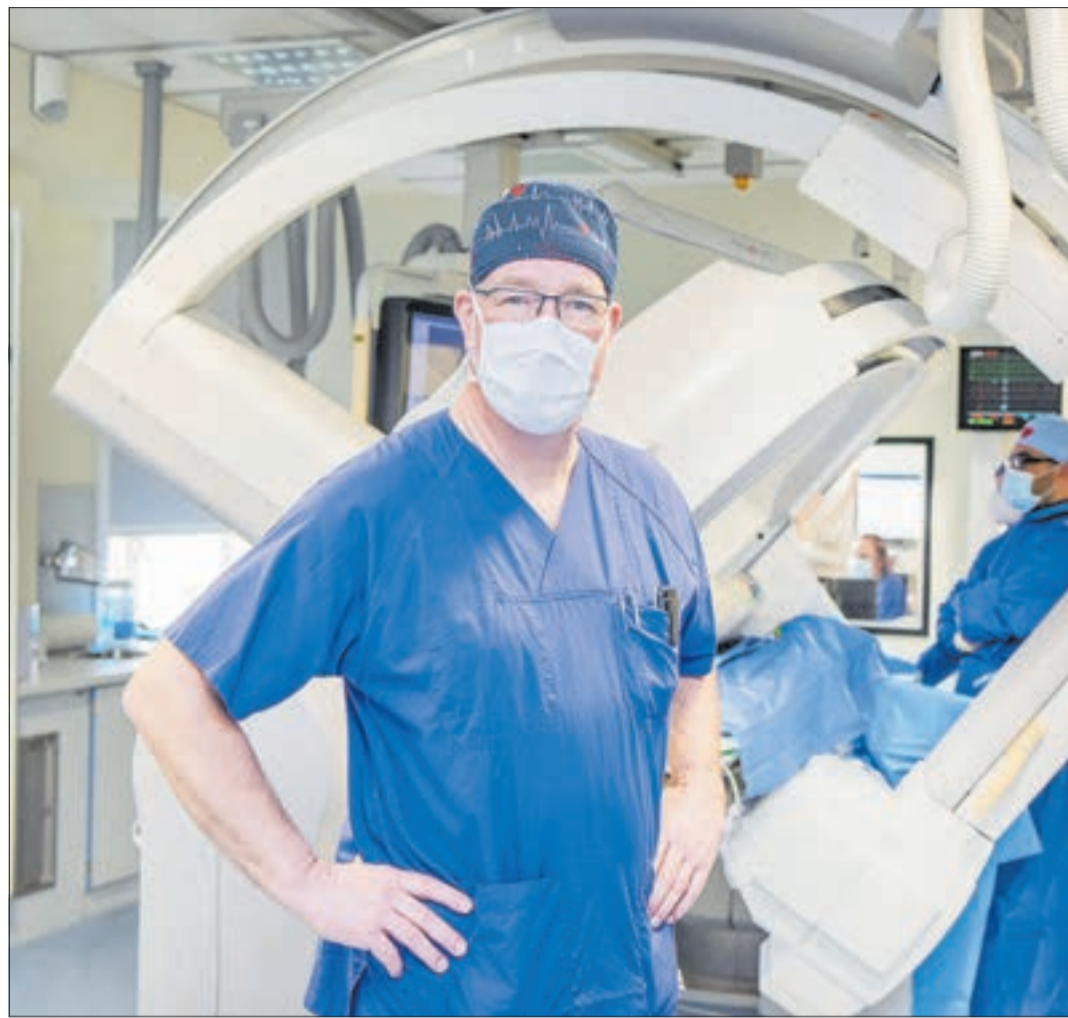
Im Auer Herzkatheter-Labor steht rund um die Uhr an 365 Tagen im Jahr ein Team für eine schnelle Diagnostik und Therapie bei Herzkrankungen zur Verfügung.

Der Erzgebirgskreis liegt dabei traurigerweise ganz weit vorn bei den Herzkrankungen als Todesursache Nummer 1. Täglich sterben hier fast 100 Menschen daran. Der Grund: Das metabolische Syndrom! Fachleute fassen unter diesem Begriff die vier Haupttri-