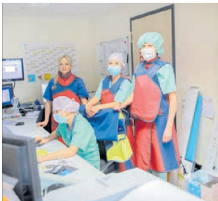
Zuletzt wurde im Helios-Klinikum die Gelegenheit des „Wear Red Day“ genutzt, um die Herzgesundheit von Frauen in den Fokus zu rücken und das Bewusstsein dafür zu schärfen.

Dazu kommt ein ausgeprägter Fatalismus nach dem Motto: Ich bin eben alt, da macht das Herz eben nicht mehr richtig mit. Das muss man hinnehmen. Doch diese Gedanken sind falsch! Dr. Ketteler: „Nein, das muss man eben NICHT hinnehmen. Heute gibt es viele Möglichkeiten, bei Problemen einzugreifen und die Lebensqualität deutlich zu erhöhen.“ Sie wollen sich doch noch lange an einem Herzchen vom Liebsten