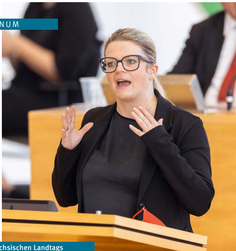
45. Sitzung des Sächsischen Landtags

// Simone Lang, Susanne Schaper