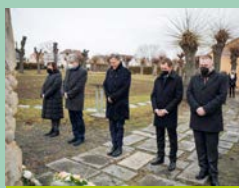
Seite 15: Gedenken an Holocaust- Opfer in der Gedenkstätte Großschweidnitz