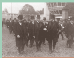
Seite 22: Max Heldt und der sächsische Landtag zur Zeit der Weimarer Republik