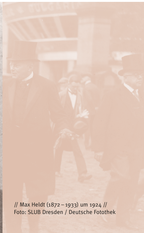
// Max Heldt (1872–1933) um 1924