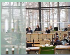
Seite 12: Öffentliche Anhörung zur Provenienzforschung in sächsischen Museen