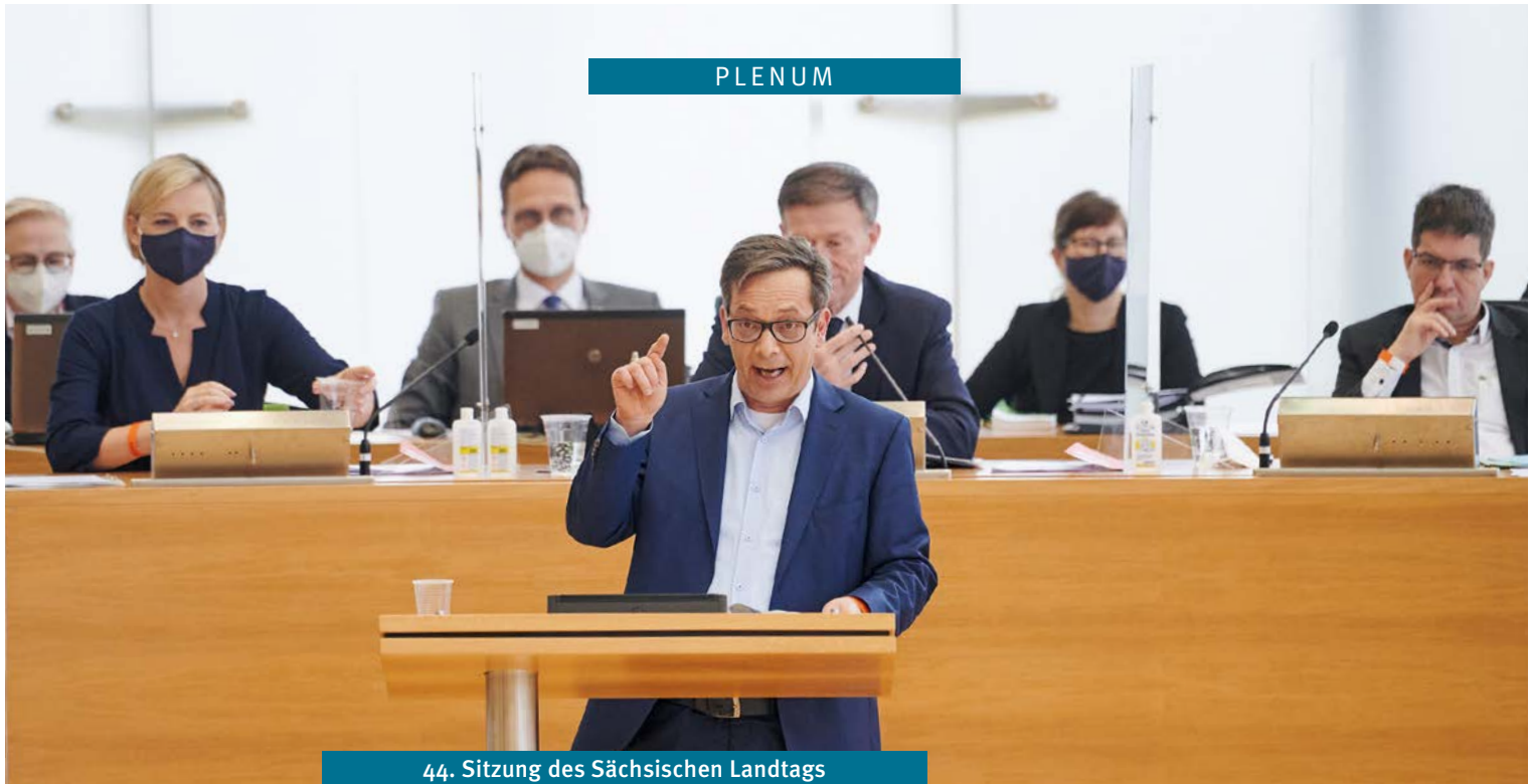
44. Sitzung des Sächsischen Landtags