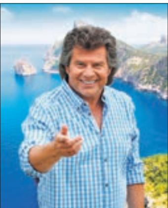
Andy Borg sorgt am 21. April im Kulturhaus in Aue für Stimmung und gute Laune.