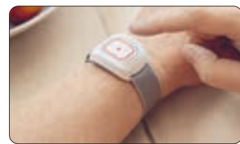
Ein kleiner Knopf mit großer Wirkung: Der Hausnotruf.

Eine Gelegenheit, den Johanniter-Hausnotruf auszuprobieren, besteht im Rahmen der Johanniter-Aktionswochen vom 06.02.2023 bis 19.03.2023. In diesem Zeitraum kann der Hausnotruf vier Wochen lang kostenlos* getestet werden. Herzstück des Johanniter-Hausnotrufs ist ein kleiner Sender, der als Armband oder Halskette getragen werden kann. Wenn Hilfe benötigt wird, genügt ein Knopfdruck, um die Hausnotrufzentrale der Johanniter zu