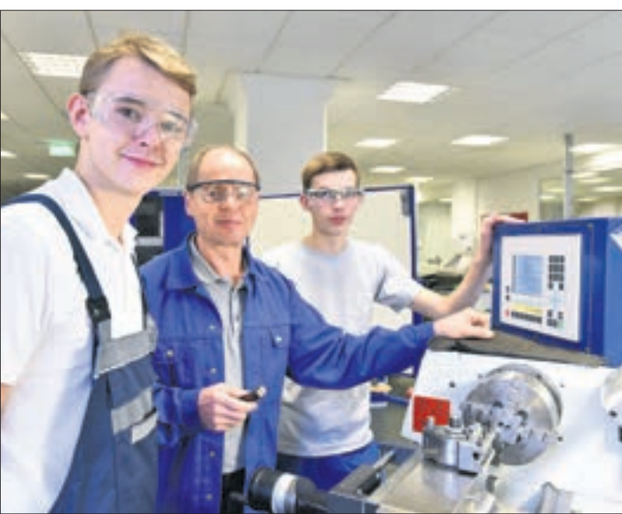
Mit 11.647 neu abgeschlossenen Berufsausbildungsverträgen konnten 700 junge Menschen mehr als 2021 ihre Ausbildung in einen staatlich anerkannten Beruf starten.