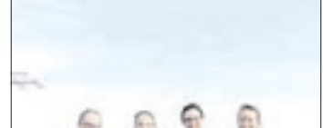
Rettungshundestaffel DRK Ortsverein Aue mit Hund Balu.

„Training Trümmersuche“, unter diesem Motto lud die DRK Rettungshundestaffel Aue-Schwarzenberg, Ortsverein Aue, am 29.10.22 Medienvertreter zu einem Informationstag ein. Neben der besser bekannten Flächensuche ist die Trümmersuche ein weiterer Bereich, in dem Rettungshunde zum Einsatz kommen. Auf dem Betriebsgelände der BBBaustoffe Wildbach GmbH fand man einen Recyclinghof, der den Anforderungen für ein Trümmer-Training gerecht wurde. Im Mittelpunkt steht bei der „Trümmersuche“ die Suche nach Menschen, die unter Trümmern verschüttet sind. Die fünf jungen Leute, die mit ihren Familien-Hunden vor Ort trainierten, bereiten sich selbst und ihre Hunde auf so einen Ernstfall vor. Diesen gab es in diesem Jahr bereits zweimal. Dabei konnte im Rahmen der Vermisstensuche auch eine Person lebend geborgen werden. Im Gegensatz zu den „Mantrailer“ Spürhunden, die auf den Individualgeruch einer Person abgerichtet sind, und auf dem Boden den Spuren nachgehen, spüren die Hunde der Rettungshundestaffel des DRK jeden Menschen auf. Ihre Fährte finden sie über Partikel in der Luft, die von allen Menschen abgesondert werden. Die DRK-Rettungshundestaffel ist eine von 15 sächsischen Rettungshundestaffeln, die für bestimmte Gebiete zu-