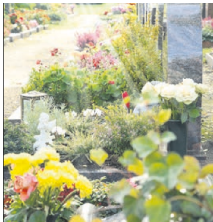
Der Friedhof ist ein Ort der Ruhe und des Gedenkens.

Hand gegeben, um einer von immer größer werdender Bedeutung geprägten Aufgabe nachgehen zu können. Nachdem diese absolviert wurde, erhält man zudem ein Zertifikat, welches besonders für soziale Berufe sehr vorteilhaft ist. Schwierige Lebenslagen bewältigen zu müssen, ist ein Umstand, der im Leben jeden treffen kann. So sind viele froh, gerade in der heutigen Zeit eine Anlaufstelle gefunden zu haben, wo ein offenes Ohr sich ihren Problemen widmet. Wenn auch Sie einen Teil dazu beitragen möchten, dann melden Sie sich, denn ohne Spenden und freiwillige Helfer ist ein solch wichtiges Angebot nicht umsetzbar. Eine passende Gelegenheit, um sich zu informieren, bietet sich am 29. November um 18 Uhr, hier findet direkt im Trauerzentrum in der Gustav-Adolf-Zeidler-Straße 5, 08297 Zwönitz ein Infoabend statt. sb