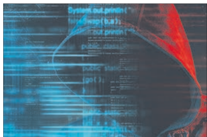
Über 100 Millionen neue Schadprogramm-Varianten sind binnen eines Jahres in Deutschland aufgetaucht.

gegenüberstanden, werden sich schon bald wiedersehen, nämlich am 15. Oktober, wenn der 1. KFC Aue wieder einlädt zu seinem „Mannschaftstreffen“.