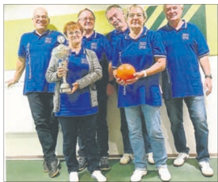
Weil der 1. Katholische Fußball-Club den Kegel-Cup zum dritten Mal gewann, darf er den Pokal behalten.

Doch die 1.001 Holz reichten diesmal nur für den vierten Platz. Aber das ist nicht so schlimm, denn bei diesem Kegeln steht nicht der Sieg im Vordergrund, sondern ganz allein die Teilnahme.