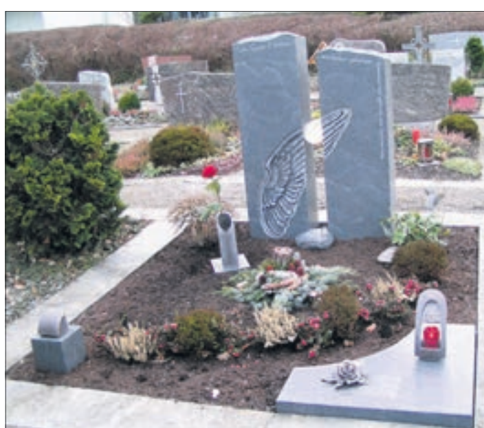
Der Grabstein ist der Mittelpunkt eines Grabes. Die Gestaltung kann ganz individuell erfolgen.

stein, Stele, Urnenstein oder Liegestein möglich. Dies lässt einen