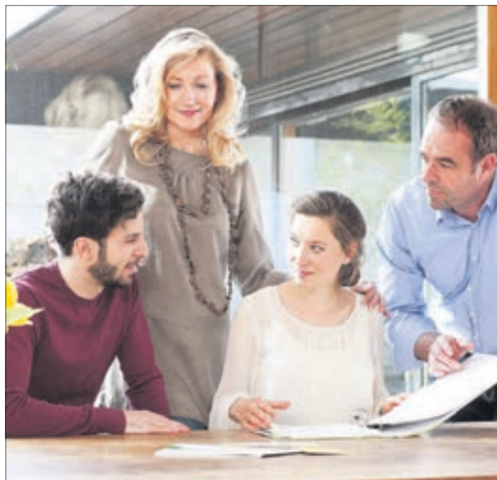
Mit der Familie offen und rechtzeitig zu besprechen, was im Todesfall passieren soll, ist wichtig und hilfreich für diejenigen, die die Bestattung später organisieren müssen.

Denn dann merken sie: Wer nicht vorsorgt, macht sich Sorgen. 13 Prozent der Befragten gaben an, dass die klaren Vorgaben ihrer todkranken Angehörigen mehr Zeit zum Trauern gelassen haben, da man sich nicht mit viel Organisation und Entscheidungsfindung beschäftigen musste. Be-