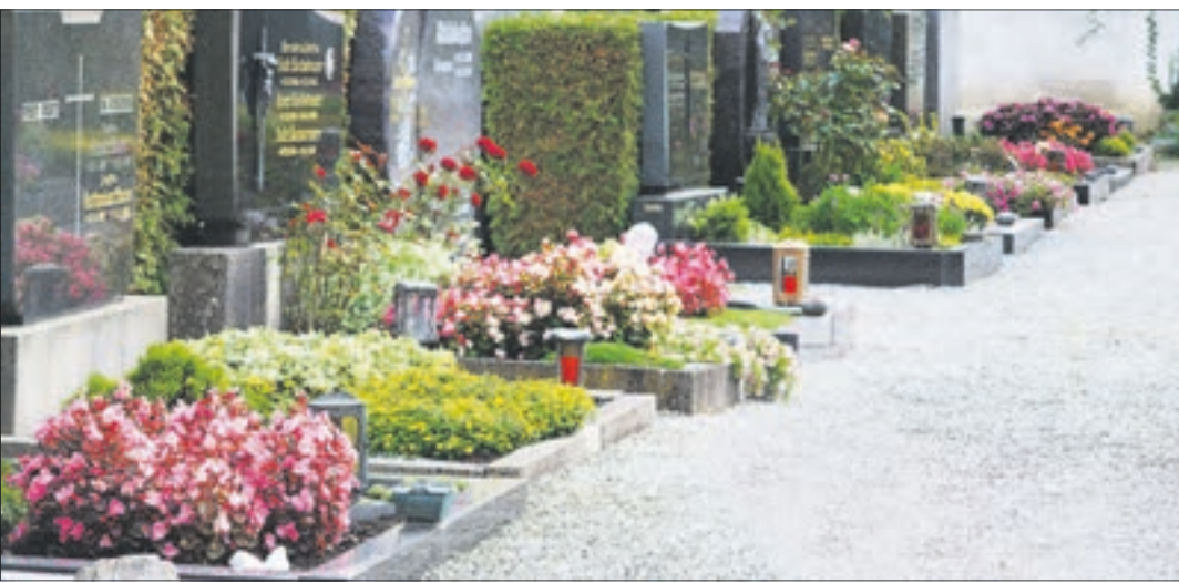
Gern wird der Verstorbenen mit Kerzen gedacht, die auf den Gräbern platziert werden.

Gedenktage, ob kirchlich oder staatlich, geben den Menschen Zeit zur Besinnung und Raum für die Erinnerung.