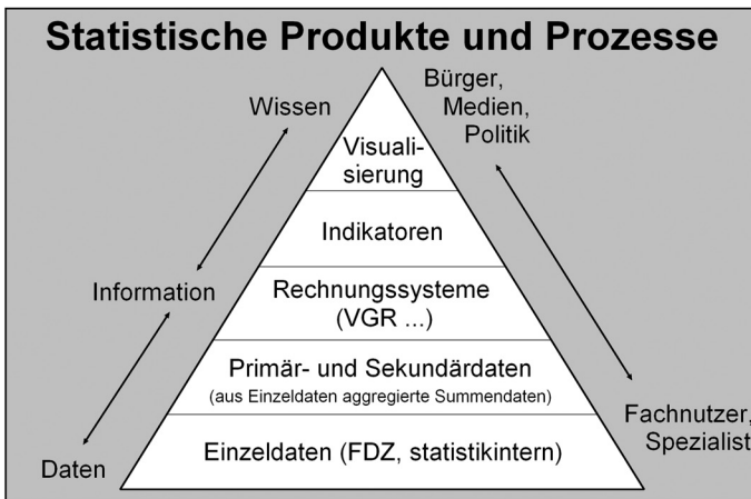
Abb. 1: Datengrundlagen für die Visualisierung (In Anlehnung an: Oppeln-Bronikowski, Raschke 2009; eigene Darstellung)

Während die Nutzung von Einzel- aber auch aggregierten Daten zum Teil besondere Methoden- und Fachkenntnisse voraussetzt (Fachnutzer, Spezialisten), wird mit den Visualisierungswerkzeugen unter „Sachsen INTERAKTIV“ angestrebt, auch dem fachfremden Nutzer die Erschließung der Daten durch die Bereitstellung einfach zugänglicher, leicht verständlicher und flexibel einzusetzender Informations- und Analysewerkzeuge in einem Anwendungspaket zu ermöglichen. Damit wird die Verständnisschwelle für die Nutzung statistischer Ergebnisse gesenkt und diese leichter auch für Laien, Presse und Politik nutzbar (vergleiche Abb. 1).