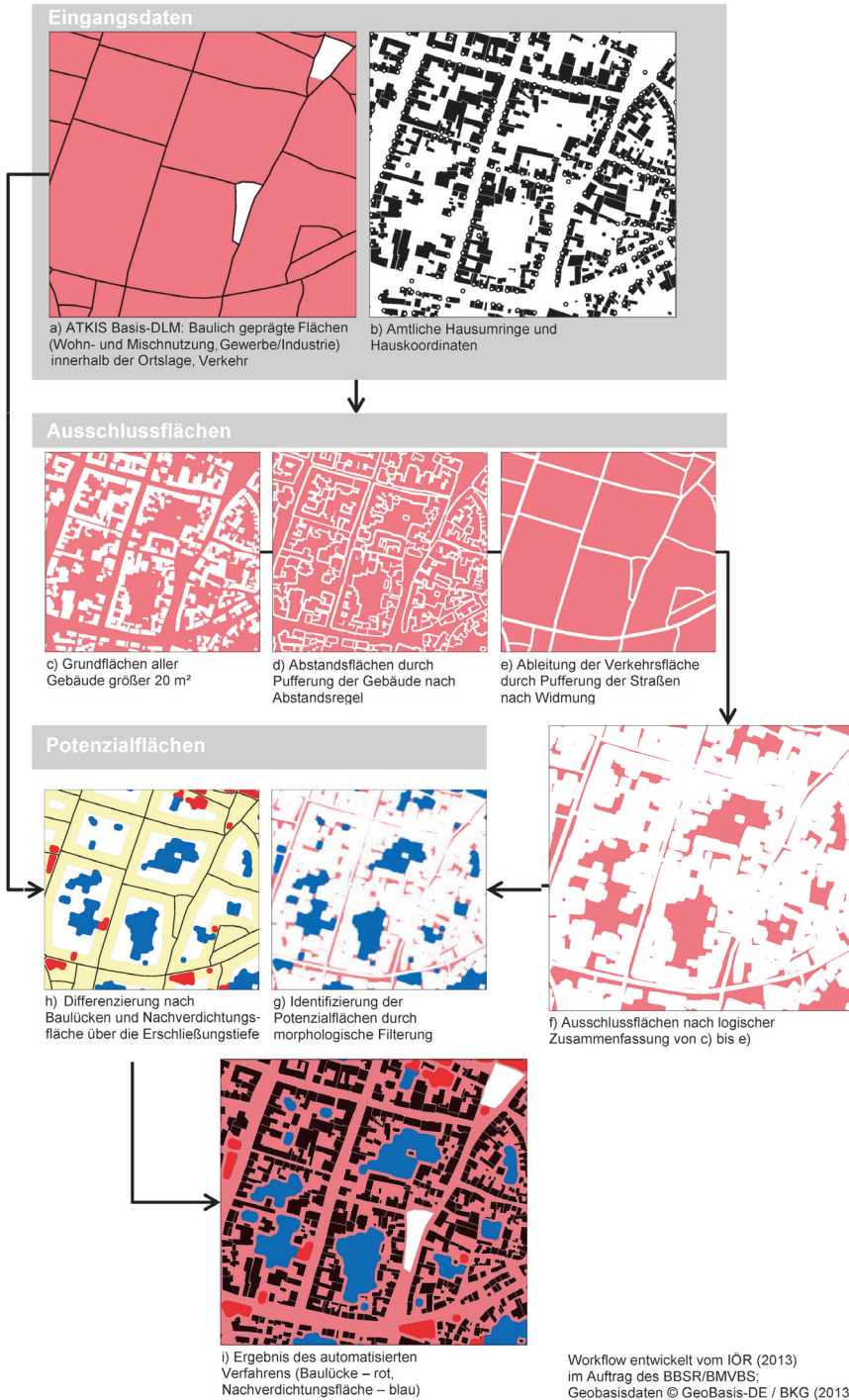
Abb. 1: Verfahrensschritte zur Identifikation von Baulücken und Nachverdichtungspotenzialen am Beispiel einer Innenstadt in Sachsen-Anhalt