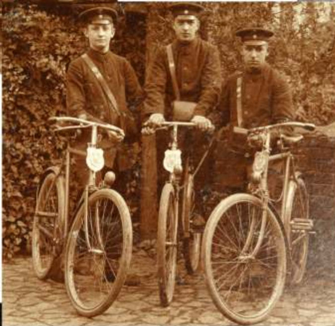
Ein Postboten-Trio auf speziellen Naumann-Rädern mit Radlaufglocken und Schmutzfängern am vorderen Schutzblech. Auf der großen Plakette befindet sich ein gekrönter Reichsadler, der in den Fängen ein Posthorn hält – das Emblem der Reichspost.