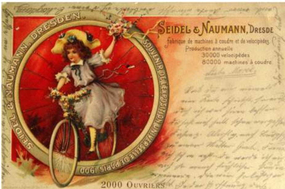
Mit dieser Postkarte warb Seidel & Naumann zur Weltausstellung in Paris im Jahr 1900