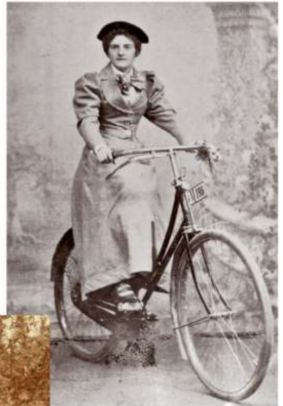
Mit schickem Kostüm im Fotoatelier auf einem Naumann-Damenrad; in ihrer linken Hand hält die Radlerin ein paar Handschuhe. Auf der Bremsstange wurden ein zweites Markenschild und das Kennzeichen befestigt.