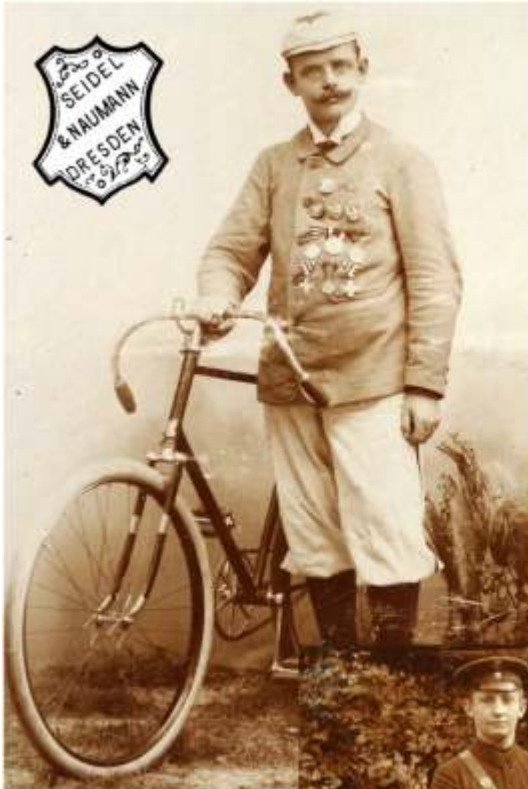
So sehen Sieger aus: Sportkappe mit aufgesetztem Stern, Schnauzbart und die Brust voller Medaillen; an der Hand ein Naumann-Halbrenner aus der Zeit um 1895. Das Markenschild wurde für die KS-Leser hinzugefügt.