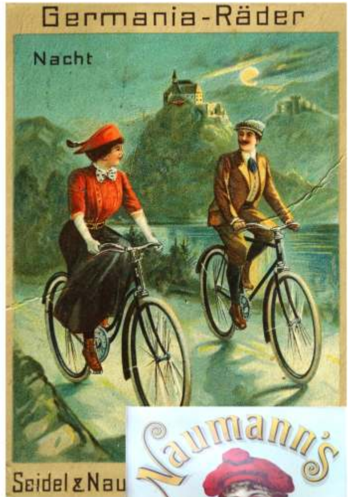
Zwei Beispiele aus einer Serie von Postkarten, die vorführen sollten, dass Seidel & Naumann-Räder zu jeder Tageszeit ihre Bedeutung haben.