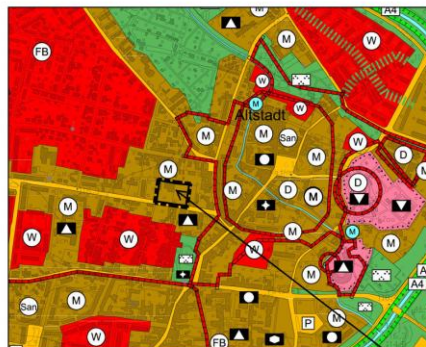
AUSSCHNITT FLÄCHENNUTZUNGSPLAN STADT HOYERSWERDA 4. ÄNDERUNG M. 1:10.000