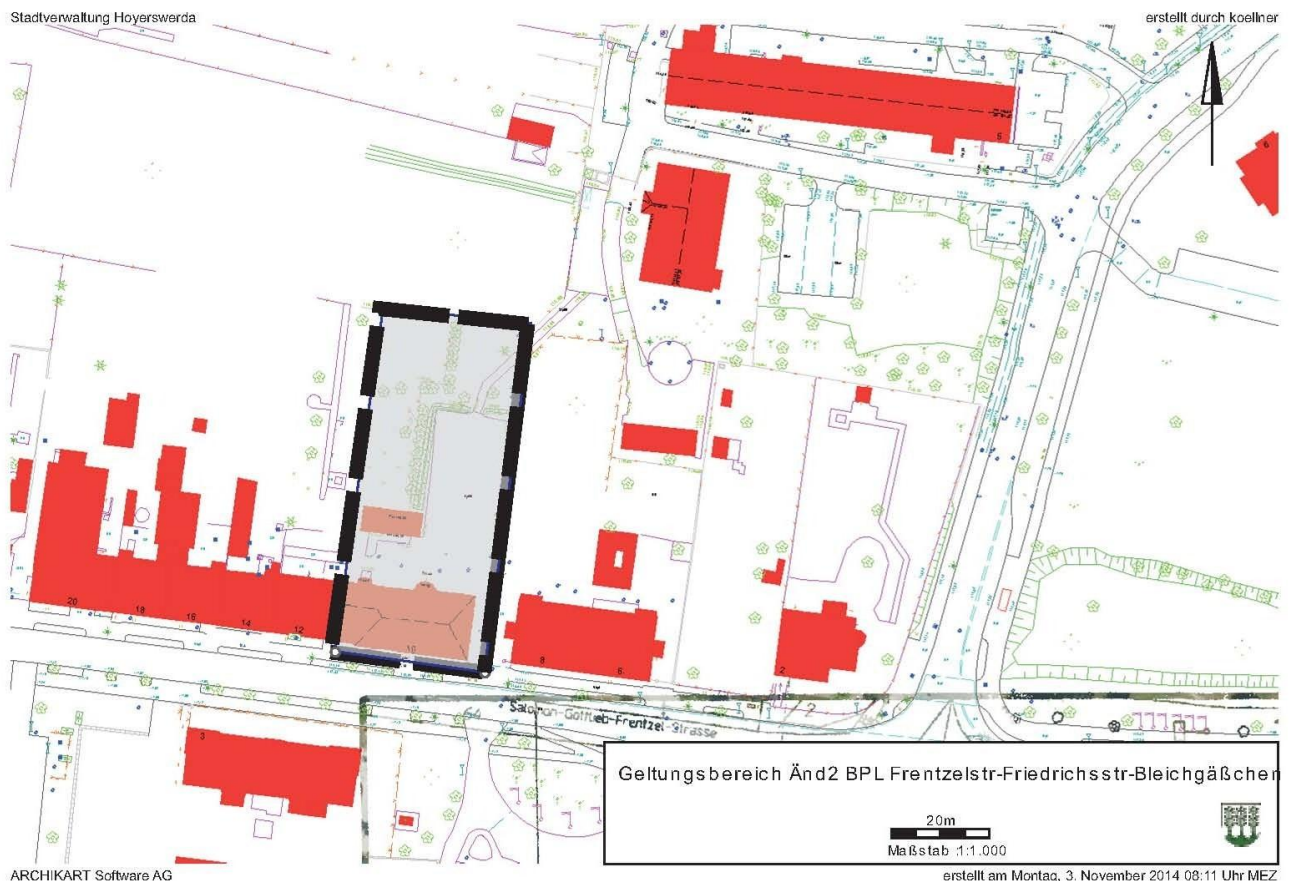
Anlage 1 zur öffentlichen Bekanntmachung der 2. Änderung des Bebauungsplanes

Da mit der geplanten Änderung des Bebauungsplans die Grundzüge der Planung nicht berührt werden, erfolgt die Änderung im vereinfachten Verfahren nach § 13 BauGB. Der Geltungsbereich der 2. Änderung liegt im Innenbereich (§ 34 BauGB). Von einer Umweltprüfung gemäß § 2 Abs. 4 BauGB wird abgesehen, da mit der angestrebten Änderung des Bebauungsplanes keine Vorhaben, welche in der Anlage 1 des Gesetzes über die Umweltverträglichkeitsprüfung aufgelistet sind, berührt werden. Es sind auch keine Anhaltspunkte für eine Beeinträchtigung von Schutzgütern, die unter § 1 Abs. 6 Nr. 7 Buchstabe b BauGB benannt wurden, zu erkennen. Somit wird vom Recht, das Änderungsverfahren als vereinfachtes Verfahren nach § 13 BauGB durchzuführen, Gebrauch gemacht.