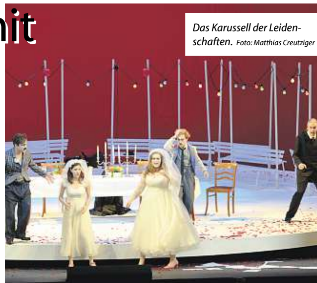
Das Karussell der Leidenschaften.

Zusammen mit dem musikalischen Leiter Omer Meir Wellber hat Kriegenburg dafür gestalterisch wie musikalisch eine unkonventionelle Art des Erzählens gefunden, ohne das Stück zu entstellen oder dessen Ursprung zu verfremden. Die Geschichte von zwei jungen Männern, die sich auf eine Wette einlassen und die Treue ihrer