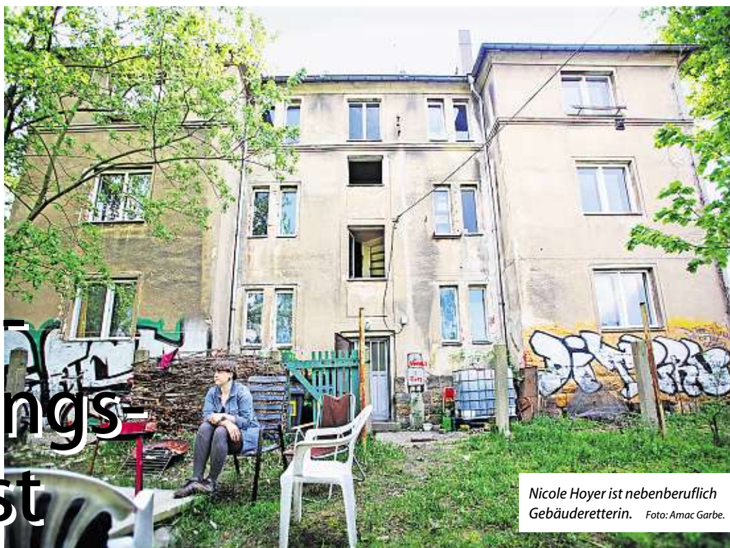
Nicole Hoyer ist nebenberuflich Gebäuderetterin.

Der Verein HausHalten Dresden versucht, sein Wächterhaus mittels Crowdfunding zu erhalten.