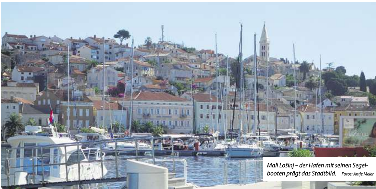
Mali Lošinj – der Hafen mit seinen Segelbooten prägt das Stadtbild.