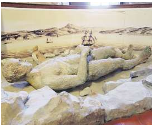
Nachbildung der Bronzestatue Apoxiomen in Veli Lošinj.

Im Palazzo Kvarner am Hafen von Mali Lošinj wird der größte Schatz der Insel bewahrt: der Apoxiomen. Im Jahr 1999 wurde die antike Bronzestatue eines Athleten aus dem 2. bis 1. Jahrhundert vor Christus vor der Küste Veli Lošinj gefunden und aus dem Meer geborgen. Man nimmt an, dass sie während eines Sturms als Opfer an die Götter für eine sichere Weiterreise ins Meer geworfen wurde.