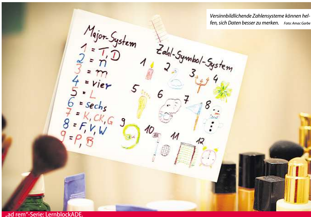
Versinnbildliche Zahlensysteme können helfen, sich Daten besser zu merken.