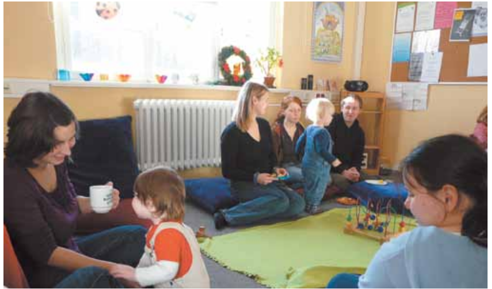
Eine schöne Tradition im Campusbüro: Das Familienfrühstück.

Das CaBü ist eine Einrichtung von TU und Studentenwerk – heißt das, dass Sie auch Studie-