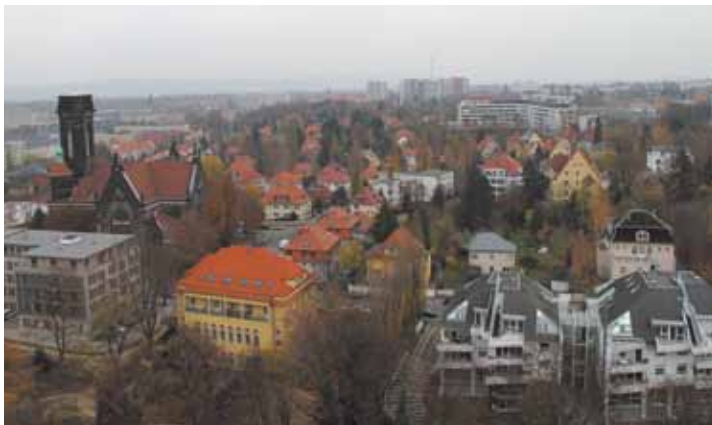
Blick aus dem Ostfenster – Zimmer mit Aussicht.