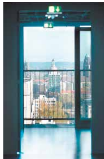
Vom Hochhaus aus schaut man bis ins Stadtzentrum.