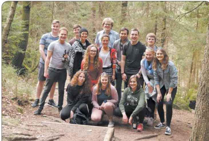
Immer für die gute Sache im Einsatz: AIAS Dresden ruft am 13. Juni zur Registrierungsaktion an der TU Dresden auf.