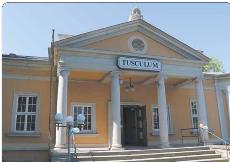
Das Tusculum hat sich wieder schick gemacht und beherbergt jetzt sechs zusätzliche Probenräume für Studentenbands.