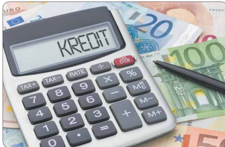
BAföG, Jobben oder einen Studienkredit beantragen? Es gibt viele Möglichkeiten, wie du dein Studium finanzierst.

Infos zur Studienfinanzierung gibt es auf www.studentenwerk-dresden.de