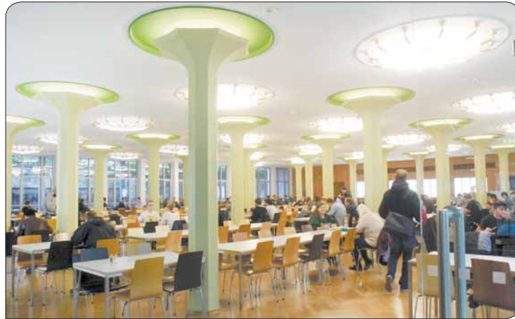
Ganz schön schick - in der Alten Mensa auf der Mommsenstraße kannst du deinen Hunger in ungewöhnlichem Ambiente stillen.

Im Potthoff-Bau kannst du in die Mensa U-Boot abtauchen. Hier steht nicht etwa Kapitän Nemo hinter der Theke, das U-Boot ist vielmehr eine Bio-Mensa mit maritimem Ambiente. Zwei Gerichte, darunter immer ein vegetarisches, Salate, Suppen, Snacks, Kuchen und belegte Brötchen können sich hungrige Studenten dort aus der Theke angeln. Schließlich gibt es noch die Mensa Stimm-Gabel in der Musikhochschule am Wettiner Platz, die Mensa in der Palucca-Schule, welche mit gesunder Vollwertkost den Ansprüchen der Tänzer gerecht wird, und die Mensa Brühl an der Hochschule für Bildende Künste. Guten Appetit!