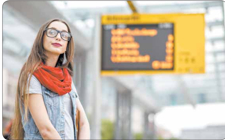
Kurze Wartezeiten an den Haltestellen musst du einplanen, ansonsten kommst du in Dresden mit den Öffentlichen ruckzuck von A nach B.

Weitere Infos findest du unter www.dvb.de und www.stura.tu-dresden.de/semesterticket