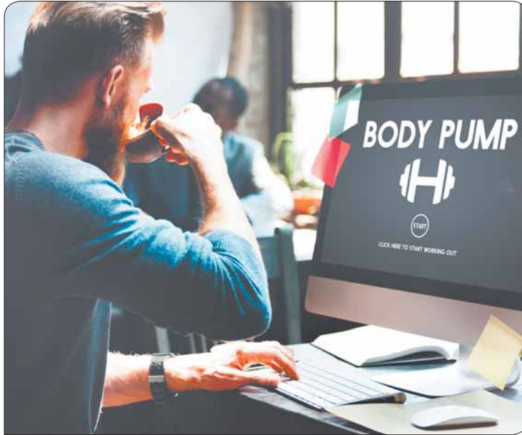
Kaffeetassen stemmen ist kein Sport. Für die Online-Einschreibung in die Sportkurse kannst du dir aber einen Koffeinkick holen.