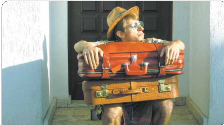
Bevor du auf der Straße sitzt, wende dich bei Streitigkeiten mit dem Vermieter z.B. an den Mieterbund oder die Rechtsberatung des StuRa.

Damit es gar nicht erst so weit kommt, sollten einige Dinge beachtet werden, bevor der Mietvertrag unterschrieben wird. „Nehmt Zeugen mit, wenn ihr euch eine Wohnung anschaut“, empfiehlt Sebastian. Sichern Makler oder Vermieter eine bestimmte Kostenhöhe zu, kann das später durch Zeugenaussagen belegt werden. Lohnenswert ist auch ein Besuch auf der Website des Deutschen Mieterbundes. Dort erhaltet ihr Infos über die durchschnittliche Höhe der Nebenkosten in Dresden (aktuell 3,03 €/m 2 ), außerdem bietet der Mieterbund einen Kurzzeitrechtsschutz für Studenten an. Wer ein bisschen Zeit hat, sollte unbedingt die Mietpreise über das Jahr vergleichen. Hier zeigt sich: Wer im Winter mietet, begegnet eher fragwürdigen Nebenkosten. Ist das Kind einmal in den Brunnen gefallen, hilft auch die Rechtsberatung des StuRa. Madeleine Brühl