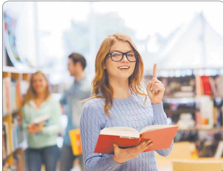
Im Lehrbuch steht nicht alles. In den ersten Wochen an der Uni solltest du auch Kontakte knüpfen und dein Studium organisieren.