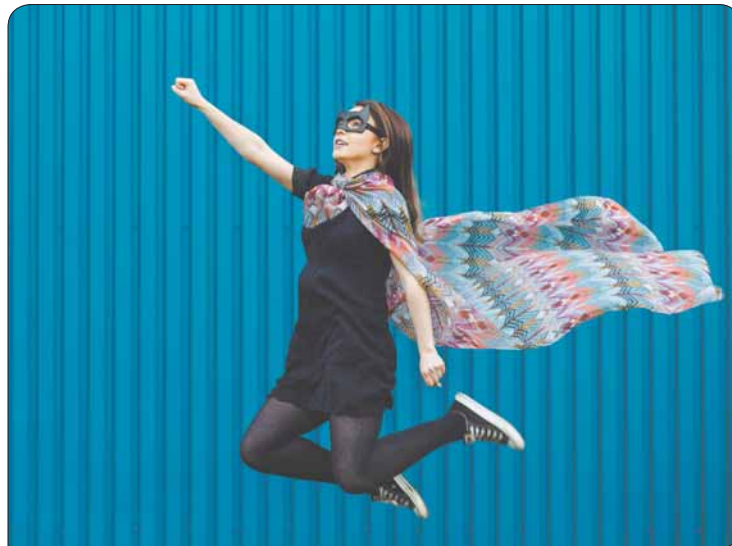
Du musst nicht Superwoman sein, um Erfolg zu haben. Der Career Service hilft auch Normalsterblichen bei Studium und Job.

Infos: https://tu-dresden.de/karriere/berufseinstieg und www.htw-dresden.de/studium/career-service.html .