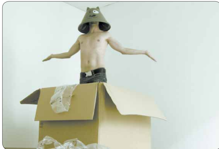
Wie du dir dein WG-Zimmer einrichtest, ist dir überlassen. Wichtig ist nur ein hieb- und stichfester Mietvertrag.