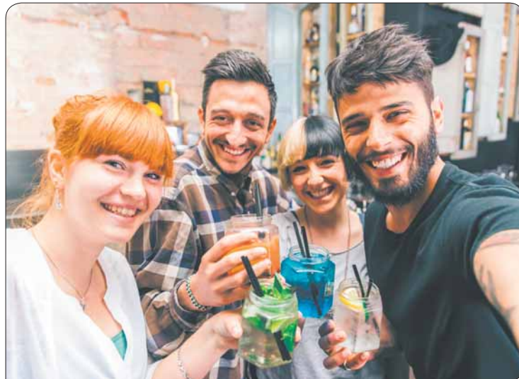
Gemütlich rumhängen, mit Kommilitonen Matheformeln durchgehen oder einfach nur Spaß haben kannst du im Studentenclub.

Mehr Infos zur ESE-Clubtour findest du auf www.exmatrikulationsamt.de/ese und bei Facebook unter ESE-Clubtour 2017.