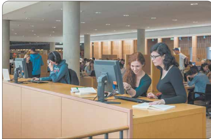
Wo du ein bestimmtes Buch findest, siehst du im Computer. Ansonsten frage einfach die Bibo-Mitarbeiter um Hilfe.