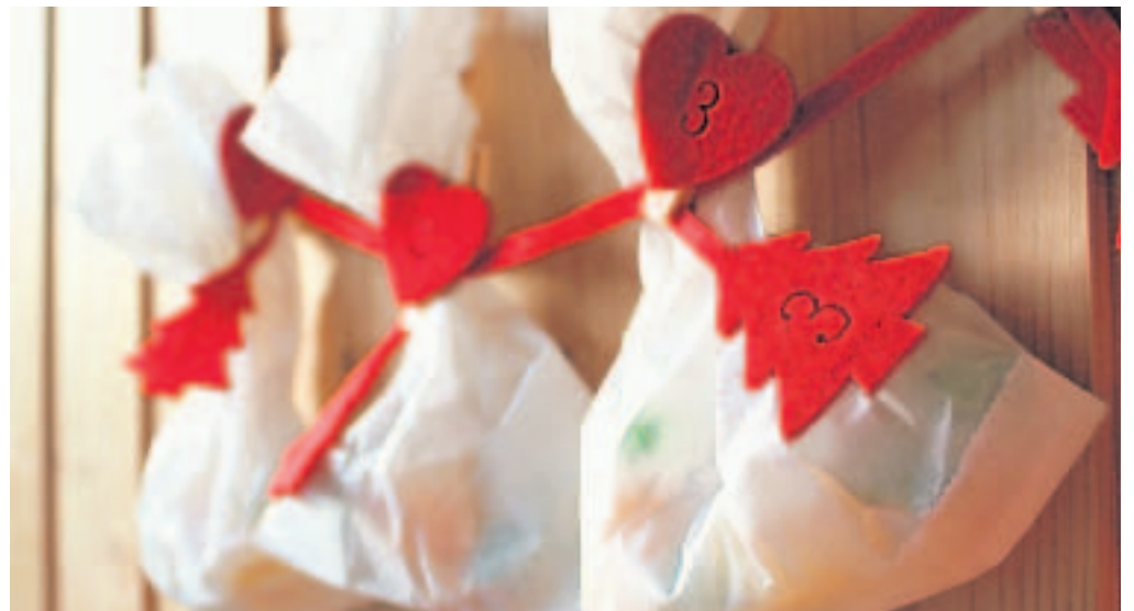
Ein Adventskalender aus Butterbrottüten ist fix gemacht und schnell geleert.