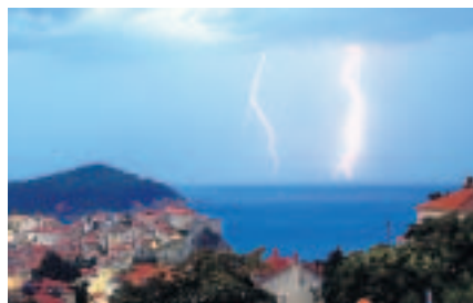
Wenn's knallt: Blitzspektakel über Dubrovnik.

Torbogen in einer Altstadtgasse dient als Unterschlupf. Erbar-mungslos prasseln die Regenmassen auf das Kopfsteinpflaster, während im Sekundentakt der nachtschwarze Himmel erleuchtet. Ein Anblick schauerhaft und faszinierend zugleich. Die durchtränkten Klammotten, die Schlafsäcke auf der Wiese, das alles gerät in Vergessenheit. Auf der Rückfahrt erweist sich ein aus der Ferne rötlich schimmerndes Leuchten als Waldbrand.