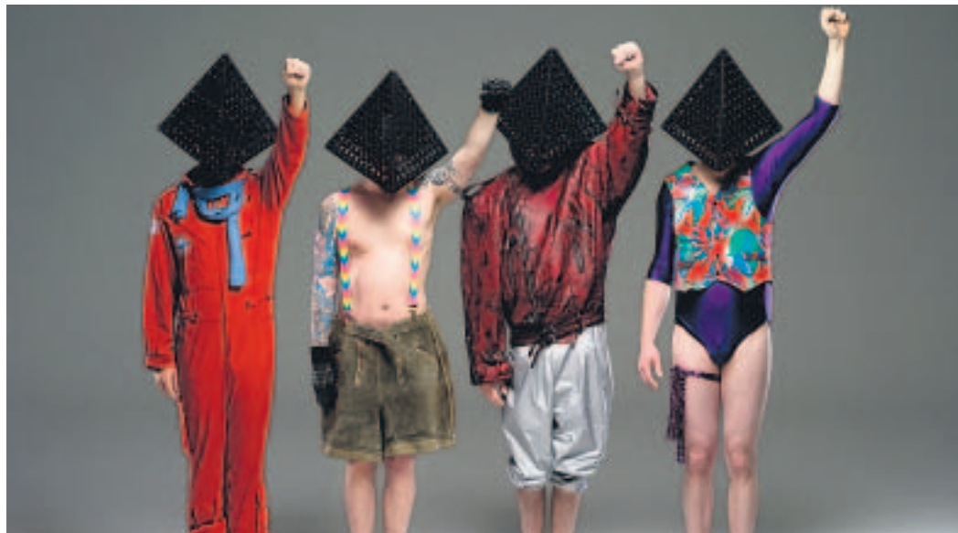
Wollen mehr als „Krawall und Remmidemmi“: die Vier von DEICKIND aus Hamburg.

In Eurem Album rechnet Ihr mit vielem ab, bringt Gesellschaftskritik auf den Punkt. Wie viel politisches Statement fließt in Eure Songs ein?