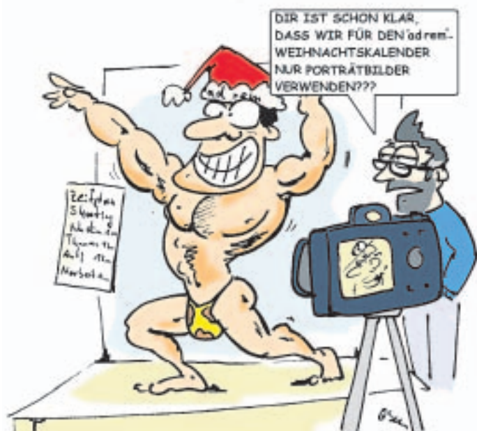
Für den „ad rem“-Adventskalender legen wir uns voll ins Zeug. Kari: Norbert Scholz