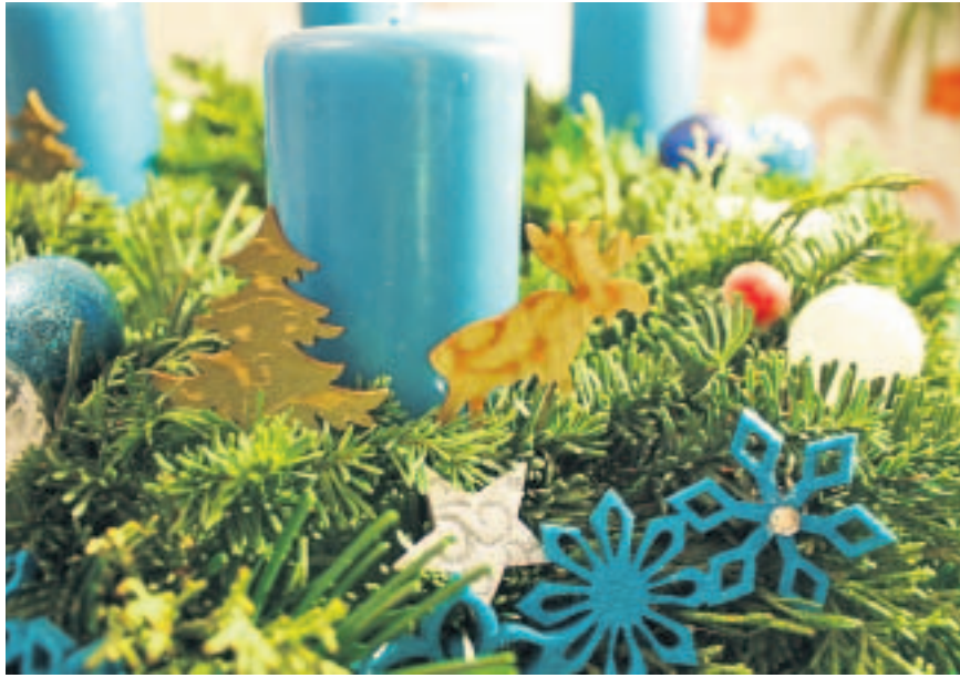
Ein frisch gebundener und nach eigenem Geschmack dekorierter Adventskranz.

Am besten gleich zum nächsten Waldspaziergang die Gartenscheere mitnehmen und einfach Tannen, Fichten- oder Kieferngrün direkt in der Natur einsammeln. Wer keine Zeit zum Schlendern oder einfach keinen Wald in direkter Nähe hat, der kann sich mit dem entsprechenden Grünzeug auch beim Floristen oder Baumarkt ausstatten. Bei beiden gibt es auch Strohkränze zu erwerben. Anfänger sollten vielleicht nicht gerade mit dem größten Strohkranz anfangen, denn einen Kranz zu binden beansprucht schon etwas Zeit und Geduld.