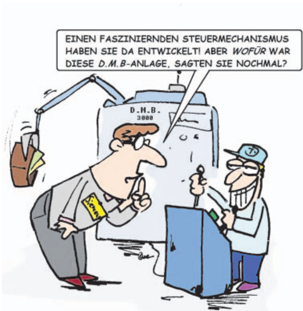
Eine Innovation für jede Universität: der D.M.B 3000 - der Drittmittelbeschaffer der Zukunft.

An der TU Dresden wurden im Jahr 2011 über 5000 Projekte durch Drittmittel finanziert. Eines davon ist das Projekt Energieeffizientes Fahren 2014/2, an dem neben fünf Lehrstühlen der TU Dresden unter anderem auch die Stadt Dresden und große Wirtschaftsunternehmen wie BMW, Daimler und Bosch beteiligt sind. Finanziert wird das Projekt durch das BMBF. „Durch den geschickten Einsatz von Verkehrs-telematik-Systemen können Informationen ins Automobil gebracht werden, die dem Fahrer