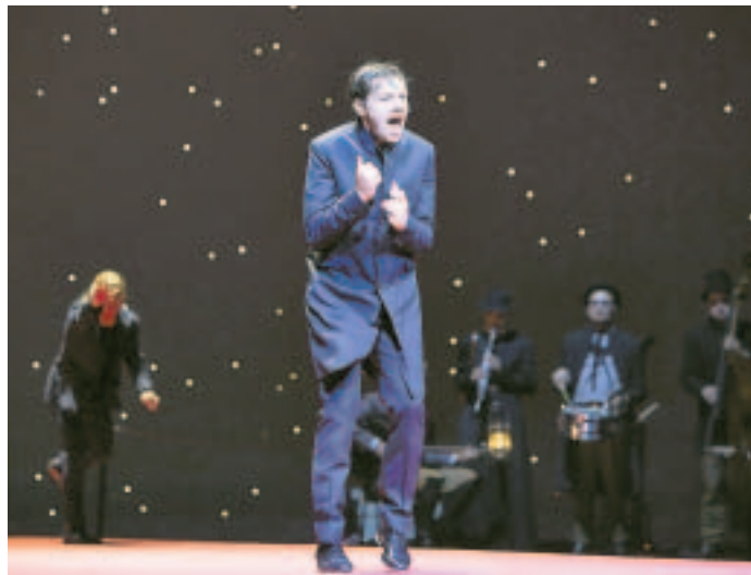
Christian Friedel brilliert als Hamlet.

Was sich hier vielleicht wie riesiger Klamauk anhört, entpuppt sich im Laufe des Abends jedoch als knallhartes, durch und durch fesselndes Schauspiel, bei dem die Musik zwar eine große Rolle spielt, jedoch nicht mehr in ihren Bann zieht als die eigentliche Kunst eines brillanten Ensembles.