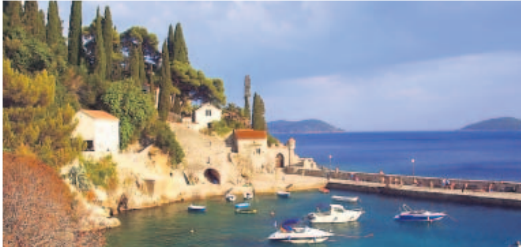
An Buchten mangelt es, wie hier in Trsteno, an der Adria nicht.

Seit dem Zerfall Jugoslawiens entwickelt sich Kroatien prächtig. Ein Streifzug entlang der Adriaküste zwischen Meer und Gebirge – Wolkenbruch und Waldbrand inklusive.