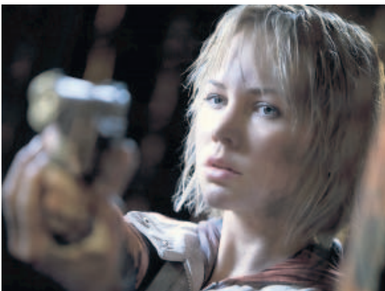
Heather (Adelaide Clemens) muss sich wehren.

Der Horror-Thriller „Silent Hill: Revelation 3D“ von Regisseur Michael J. Bassett kann nicht an die Qualität des ersten Teils von 2006 anknüpfen.