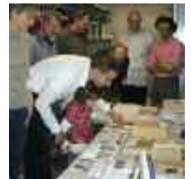
Mitarbeiter der Firma Jehmlich besichtigen historische Firmenschriften in der SLUB

Der Orgelbau in Sachsen ist ein wichtiger mittelständischer Wirtschaftszweig, geprägt durch Tradition und Innovation. Mit Tonaufnahmen, Fotografien und umfangreicher Literatur ist das Wissen dieses Kunsthandwerks in der Bibliothek dokumentiert und wird von Generation zu Generation weitergegeben.