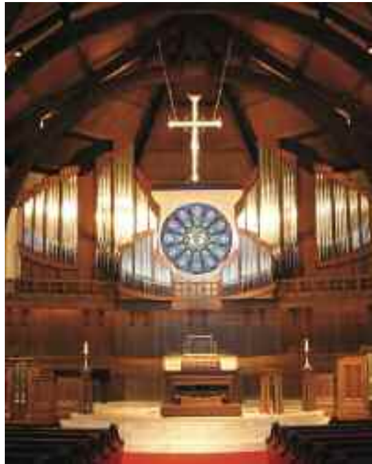
links // Die Orgelbauer arbeiteten drei Wochen am Aufbau und der technischen Montage der Orgel in der First Presbyterian Church in Kerrville (Texas, USA)