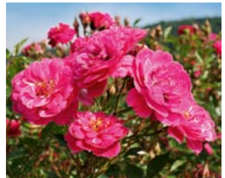
'Purple Rain' (Kordes, 2008)