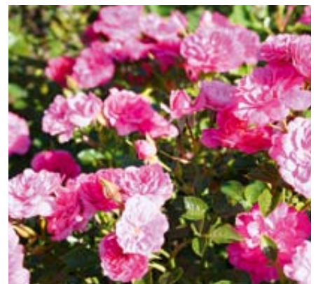
'Knirps' (Kordes, 1997)