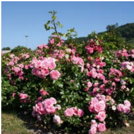
'Pink Swany' (Meilland, 2003)