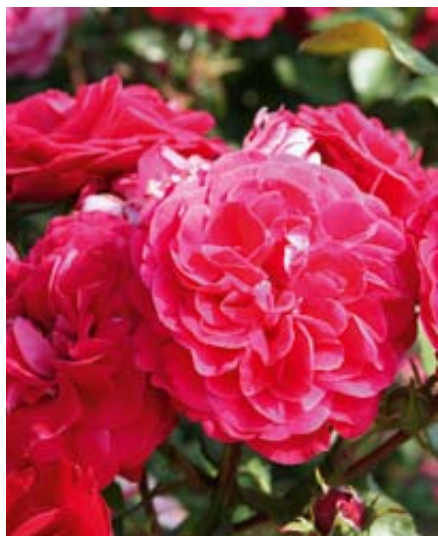
'Rouge Meilove' (Meiland, 2005)

Im Lehr- und Sichtungsgarten des Landesamtes für Umwelt, Landwirtschaft und Geologie (LfULG) in Dresden-Pillnitz wurde 1993 eine umfangreiche Pflanzung von Kleinstrauchrosen/Bodendeckerrosen angelegt. Diese wird mindestens alle zwei Jahre um neue, aktuelle Züchtungen bekannter deutscher und ausländischer Züchter ergänzt. Auch einige interessante robuste Beetrosen finden sich in diesem Sortiment wieder. Bis zum Jahr 2011 wurden in Pillnitz rund 320 Rosensorten intensiv in allen Merkmalen wie beispielsweise Blütenfarbe, Blütenfüllung und Blühhäufigkeit, aber auch Wuchsform, Wuchshöhe, Frosthärte und vor allem Krankheitsanfälligkeit geprüft und beschrieben. Grundsätzlich wird auf alle chemischen Pflanzenschutzmaßnahmen verzichtet. Nur so können nach einem Prüfzeitraum von drei bis vier Jahren relativ sichere Aussagen zum Verhalten gegenüber Rosenkrankheiten gemacht werden. Diese sind auf die Klima- und Bodenbedingungen in Pillnitz und vergleichbarer Standorte bezogen. Ziel ist es, Landschaftsgärtner, Baumschulen und Gartenbesitzer bei der Auswahl geeigneter Rosensorten zu unterstützen.