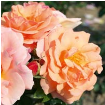
'Aprikola' (Kordes, 2000)