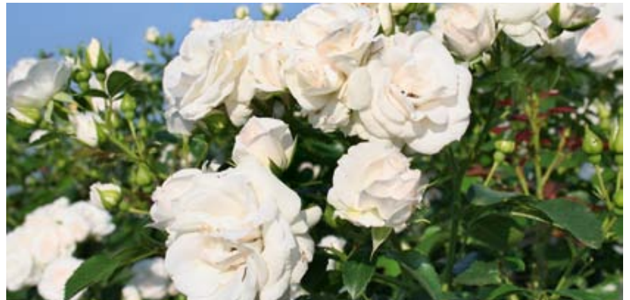
'Aspirin Rose' (Tantau, 1995)