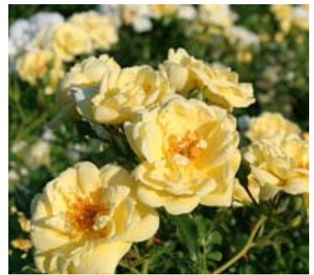
'Sunny Rose' (Kordes, 2001)