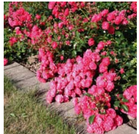
'Gärtnerfreude' (Kordes, 1999)

»Allgemeine Deutsche Rosenneuheitenprüfung«; Das Prädikat wird verliehen nach einer 3-jährigen Prüfung an 11 deutschen Standorten für hervorragende Eigenschaften, insbesondere bei der Gesundheit ( www.adr-rose.de ).