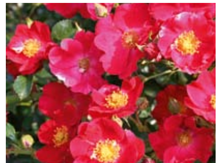
'Alcantara' (Noack, 1999)