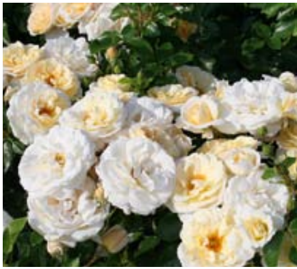
'Isarperle' (Noack, 2004)