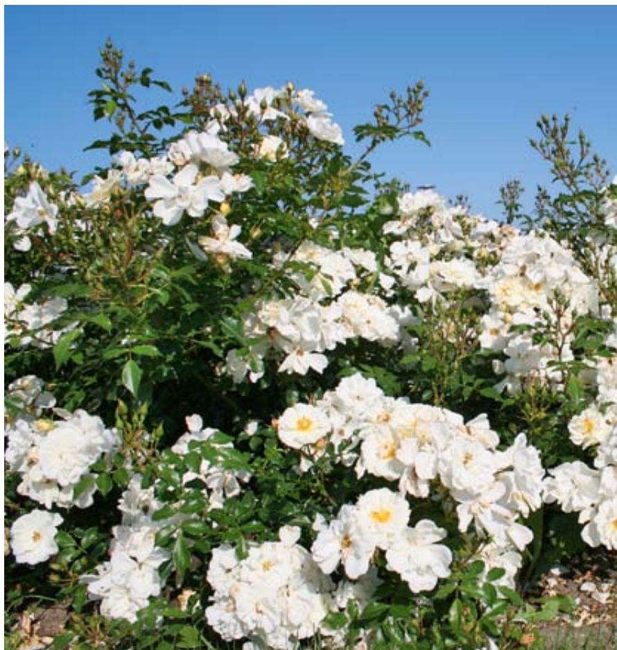
'Diamant' (Kordes, 2001)