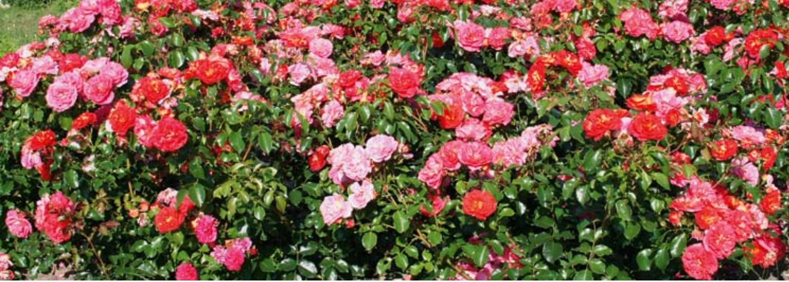
'Gebrüder Grimm' (Kordes, 2002)