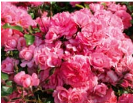
'Bad Birnbach' (Kordes' Söhne, 1999)