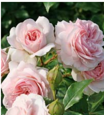
'Larissa' (Kordes, 2008)