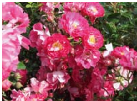
'Lipstick' (Tantau, 2009)

Ein weiterer Vorteil besteht darin, dass das gesunde Laub den Boden bei flächigen Pflanzungen so beschattet, dass einjährige Unkräuter kaum auflaufen können. Inzwischen haben sich viele Rosenzüchter dieser Züchtungsrichtung angeschlossen. Insbesondere bei den Kleinstrauchrosen/Bodendeckerrosen und den Beetrosen, die für Pflanzungen auf öffentlichen Grünflächen in Betracht kommen, aber auch in jedem Hausgarten Verwendung finden können, hat sich ein großes und vielfältiges Sortiment gesunder und widerstandsfähiger Züchtungen entwickelt.