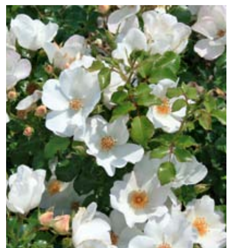
'Venice' (Noack, 2003)