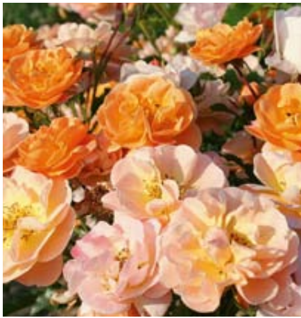
'Sedana' (Noack, 2002)