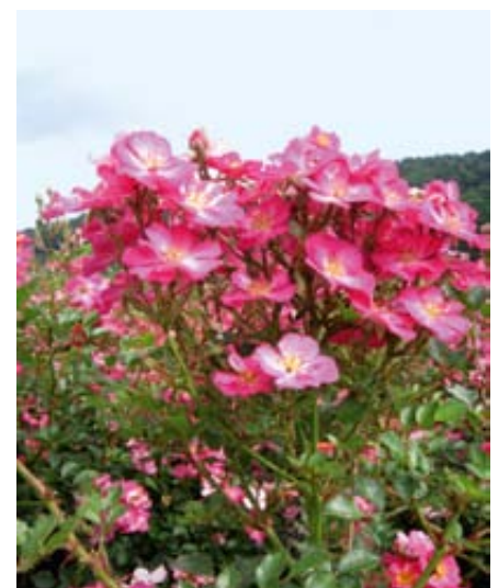
'Lupo' (Kordes, 2006)