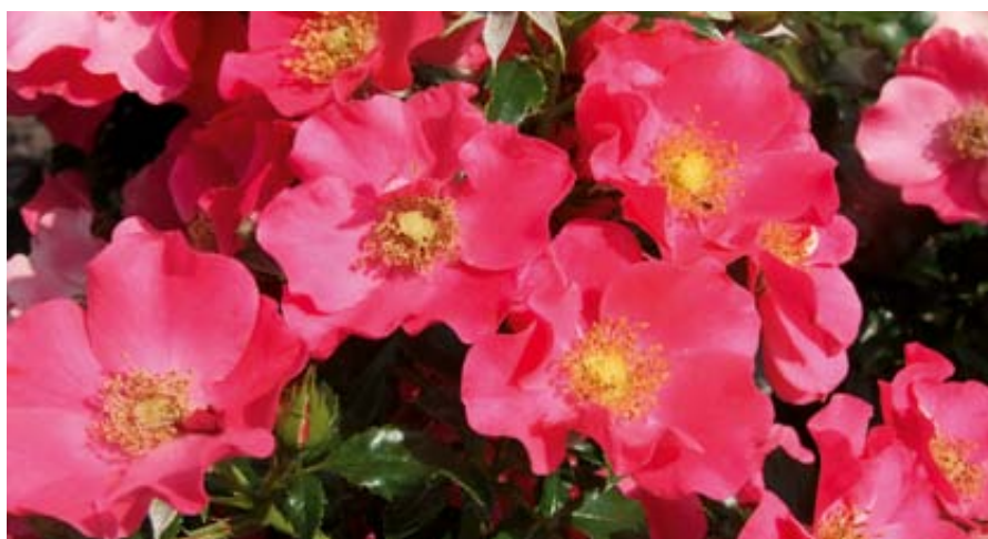
'Stadt Rom' (Tantau, 2007)