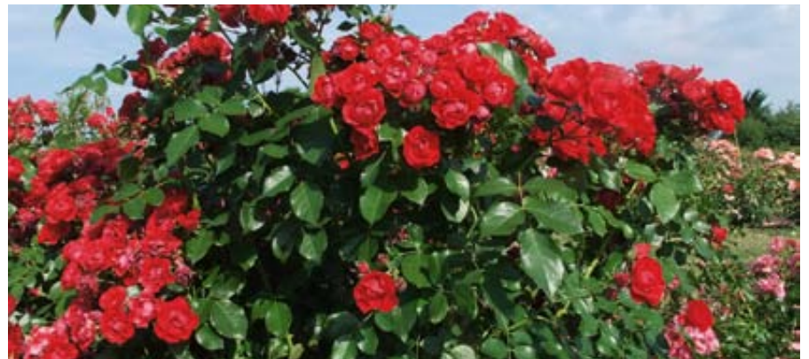
'Black Forest Rose' (Kordes, 2010)