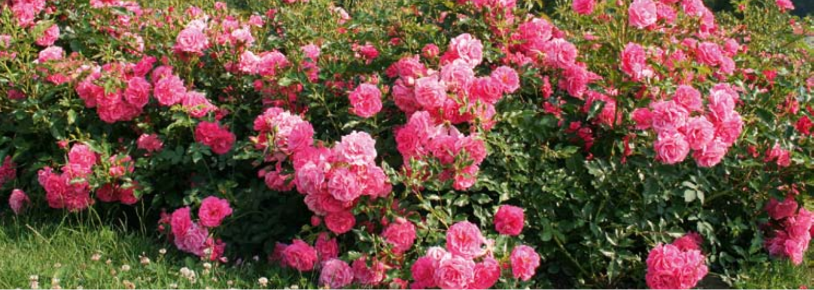
'Heidtraum' (Noack, 1988)