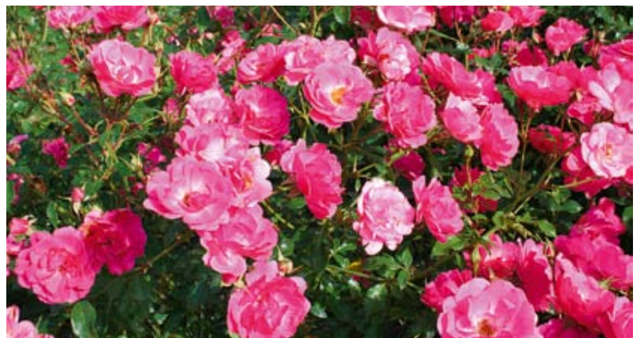
'Bad Wörishofen 2005' (Kordes, 2005)