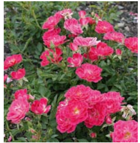
'Limesstern' (C. Pearce, 2006)