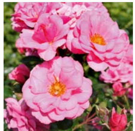
'Medley Pink' (Noack, 2003)