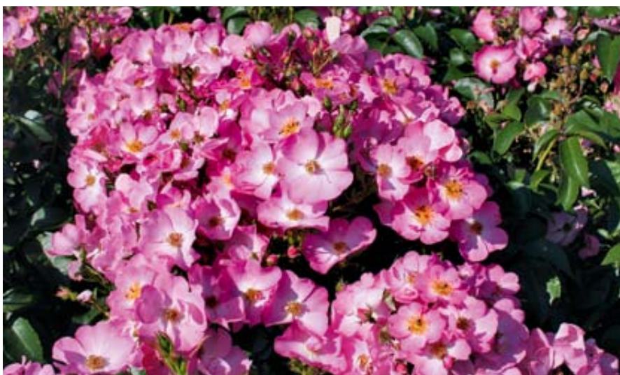
'Phlox Meidiland' (Meiland, 2000)