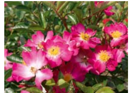
'Fil des saisons' (Lens, 2003)