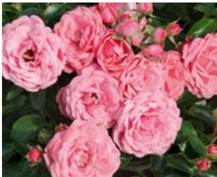
'Alea' (Noack, 2006)