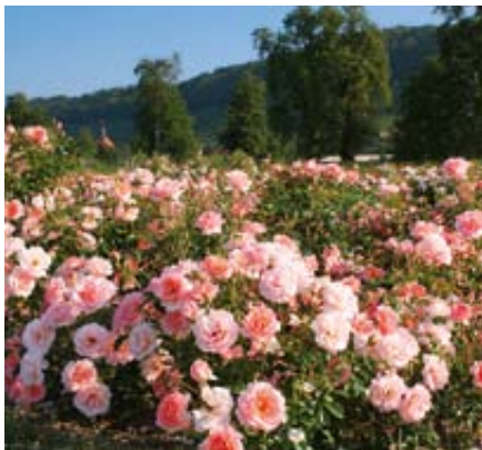
'Vinesse' (Noack, 2001)