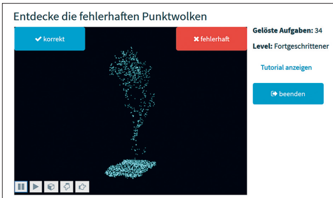
Abb. 2: 3D-MicroMapping von Vegetation – Experiment 1

waren die Nutzer aufgefordert, zwischen „sauberen“ und „fehlerhaften“ Punktwolken zu unterscheiden. Im zweiten Experiment galt es, Fehlertypen zu klassifizieren. Die Detektion der Höhe der Baumkronenbasis war Gegenstand des dritten Experiments. Dazu wurden die erstellten Vorlagen für die binäre Klassifikation (Experiment 1), die multiple Klassifikation (Experiment 2) und für die Annotation in der Punktwolke (Experiment 3) genutzt.