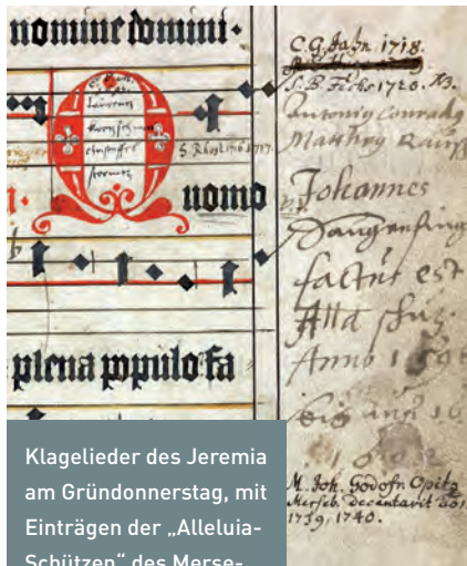
Klagelieder des Jeremia am Gründonnerstag, mit Einträgen der „Alleluia-Schützen“ des Merseburger Doms (Leipzig, Stadtbibliothek, Becker-Sammlung, II 1 2° 1, 69r) [Detail].

eine für die Erforschung der Nürnberger Liturgie- und Stadtgeschichte im Spätmittelalter zentrale Quelle anzusehen.